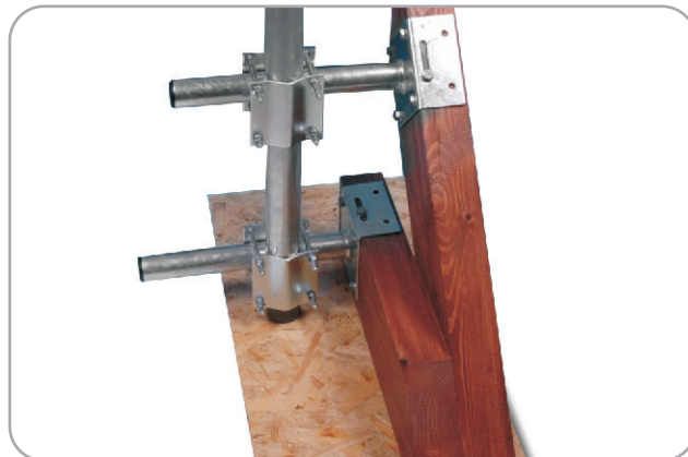
Art. nr 05.001

Mocowanie masztu składające się z dwóch części, które mocowane są do krokwi dachu. Konstrukcja uchwytów wykonana ze stali ocynkowanej ogniowo. Możliwość zamontowania masztu o średnicy 60mm. Waga: 3,3 kg. W zestawie 10 sztuk wkrętów do drewna o średnicy 8 x 50.