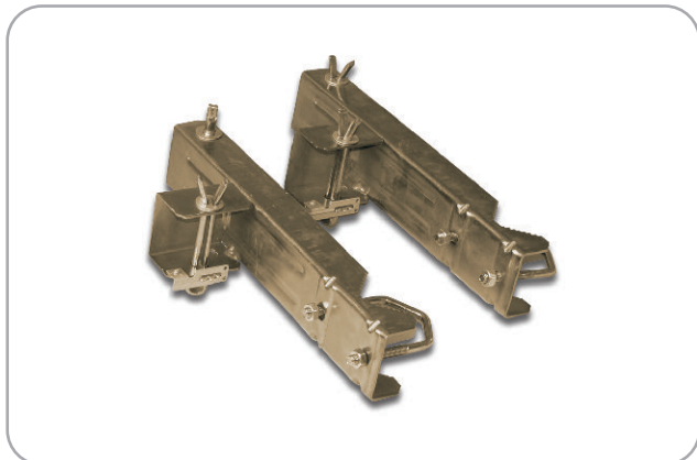
Art. nr 03.105