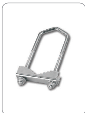
Art. nr 08.005