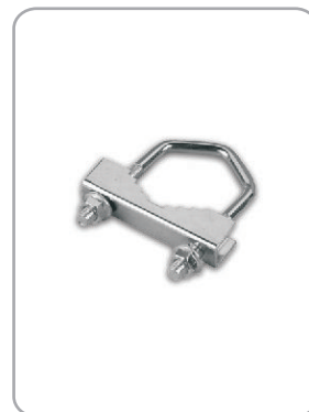
Art. nr 08.004