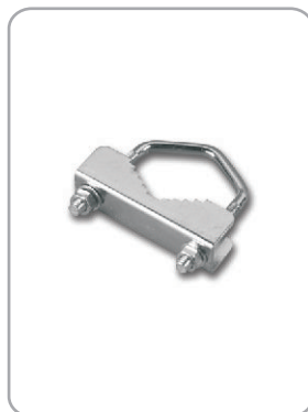
Art. nr 08.003