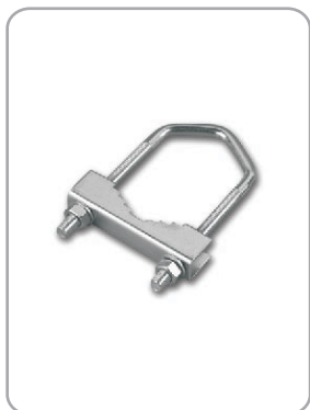
Art. nr 08.002