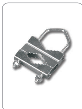
Art. nr 08.007