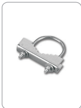
Art. nr 08.001